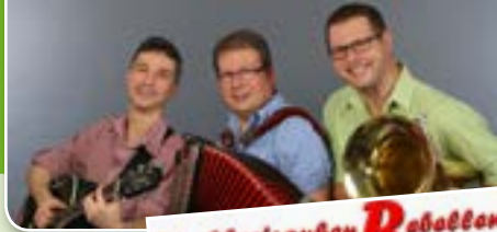
Die Oberfranken Rebellen